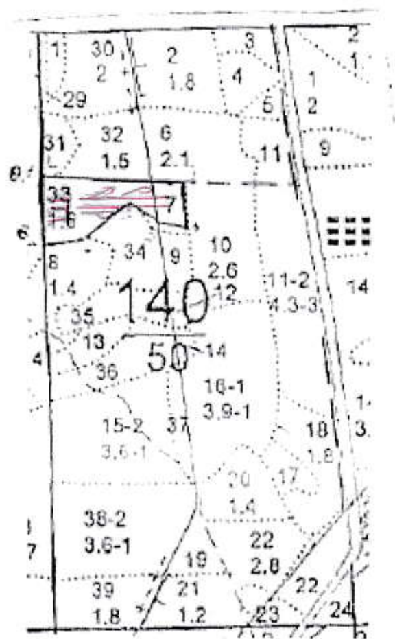
Схема (схемы) выполнения технологических операций по видам мероприятий ухода за лесами