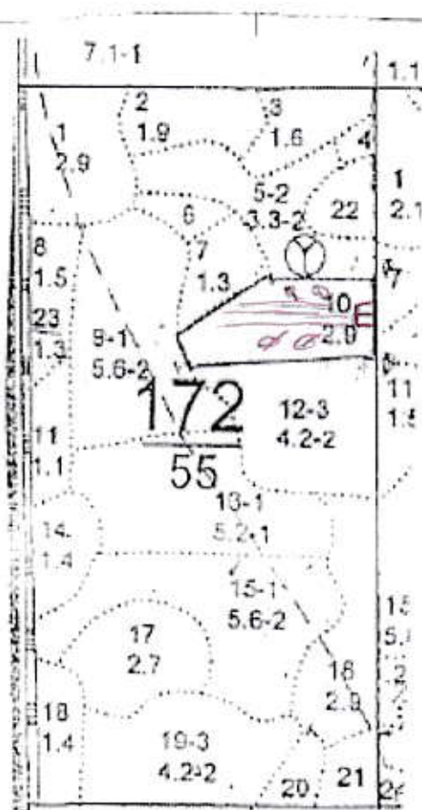
Схема (схемы) выполнения технологических операций по видам мероприятий ухода за лесами