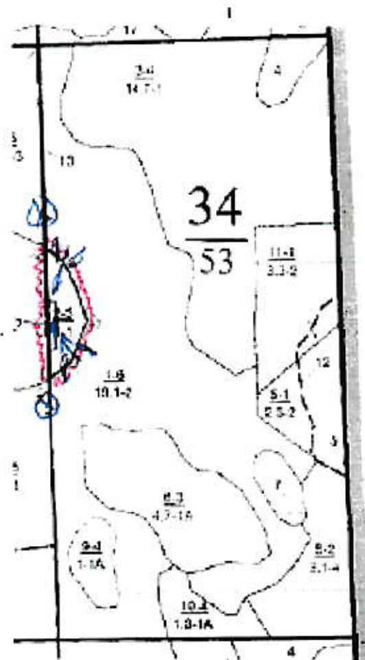
Схема (схемы) выполнения технологических операций по видам мероприятий ухода за лесами