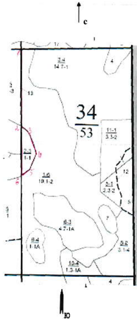
Румбы и длины линий