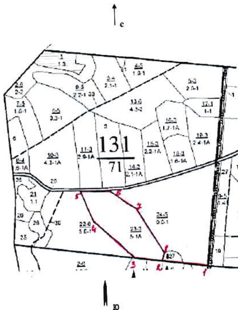
Румбы и длины линий