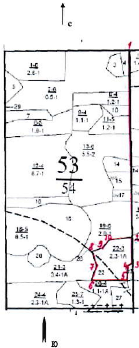
Общая схема участка и его привязки