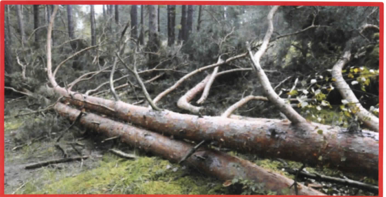
Лежащее на поверхности земли ветровальное дерево, не имеющее признаков отмирания. Не является валежником

Кроме того, необходимо обратить внимание, что деревья, которые лежат на земле, но не имеют признаков естественного отмирания (имеют зеленую листву или хвою), определять как «мертвые» не допускается (смотри изображение № 5).