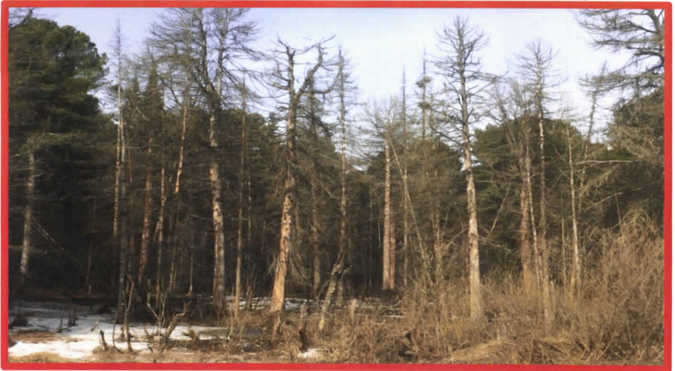
Изображение № 4 Сухостойное дерево. Не является валежником Изображение № 5

Кроме того, необходимо обратить внимание, что деревья, которые лежат на земле, но не имеют признаков естественного отмирания (имеют зеленую листву или хвою), определять как «мертвые» не допускается (смотри изображение № 5).