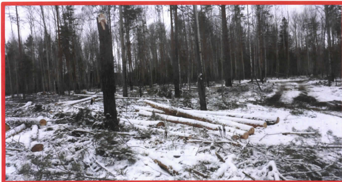
Изображение № 7 Брошенная древесина вдоль лесовозных дорог. Не является валежником