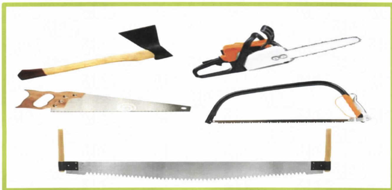
Изображение № 8 Разрешенные инструменты для заготовки

При заготовке валежника допускается применение ручного инструмента (ручных пил, топоров, бензопил) (смотри изображение 8).