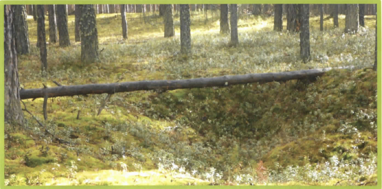
Изображение № 3 Валежник