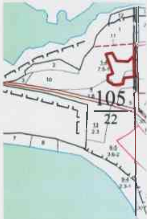
Данные инструментальной съемки границ участка