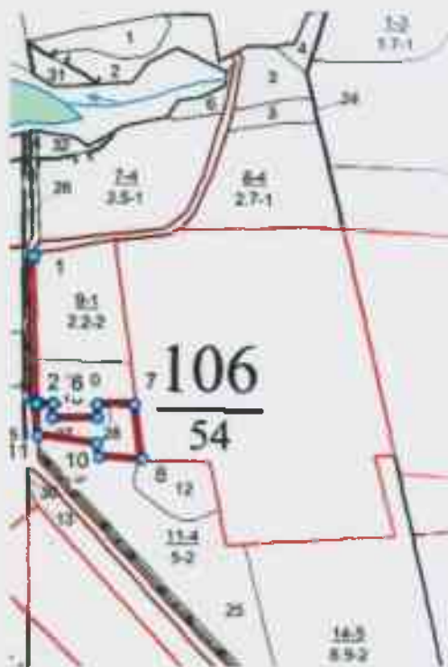
Данные инструментальной съемки границ участка

Масштаб: 1:10000 Площадь участка – 0,8 га