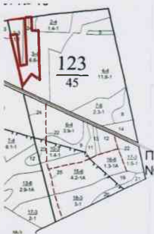
Данные инструментальной съемки границ участка