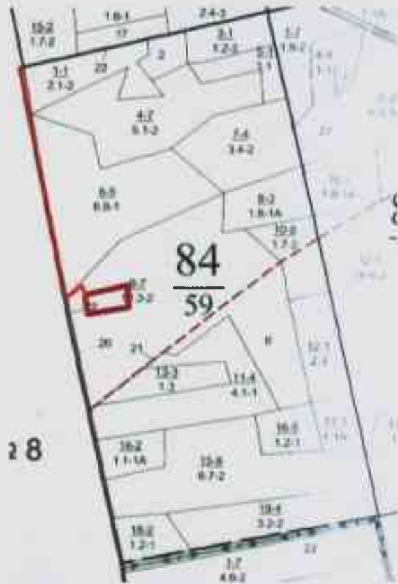
Данные инструментальной съемки границ участка

Масштаб: 1:10000 Площадь участка – 0,4 га