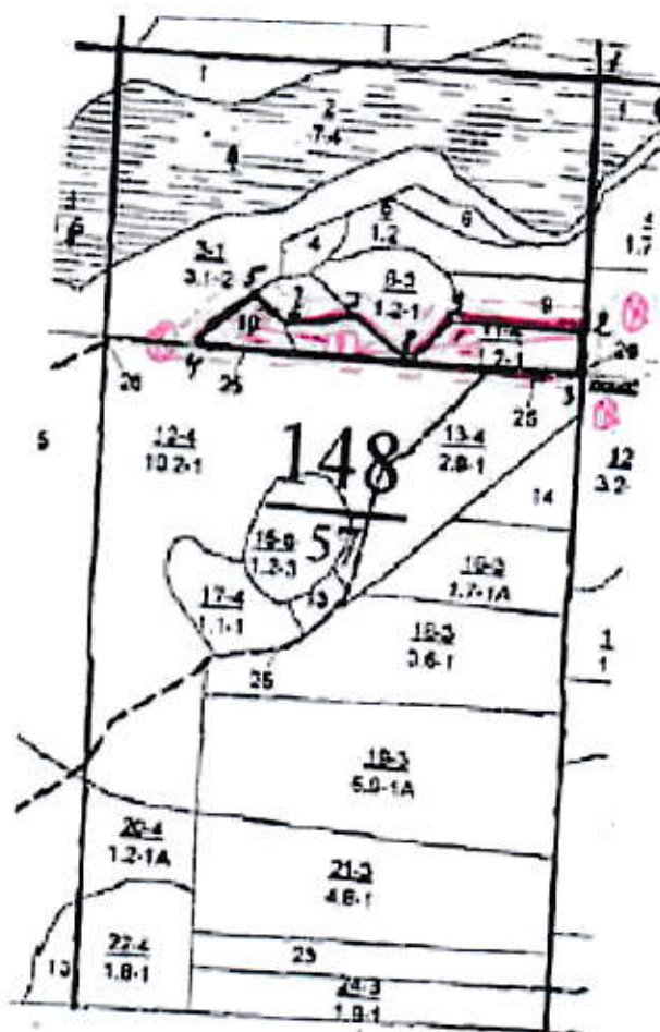
Схема (схемы) выполнения технологических операций по видам мероприятий ухода за лесами