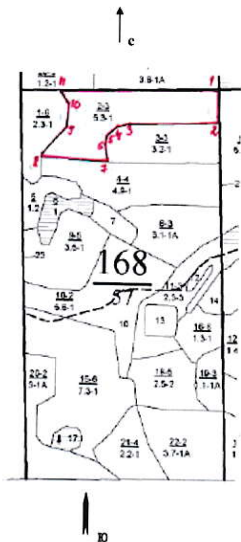
Румбы и длины линий