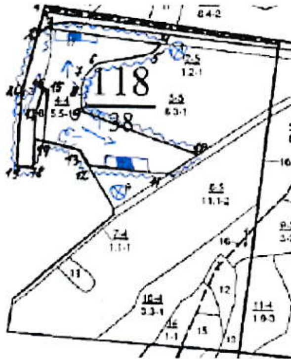
Схема (схемы) выполнения технологических операций по видам мероприятий ухода за лесами