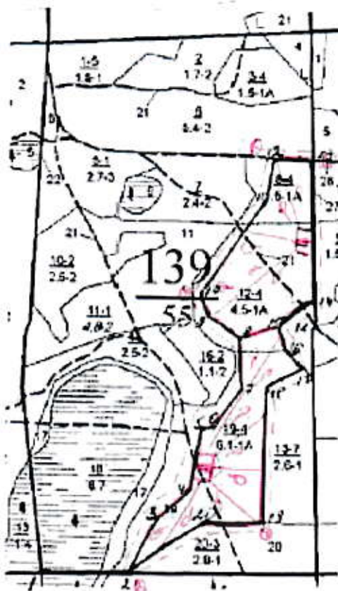
Схема (схемы) выполнения технологических операций по видам мероприятий ухода за лесами