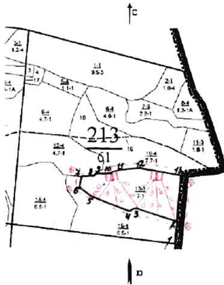
Схема (схемы) выполнения технологических операций по видам мероприятий ухода за лесами