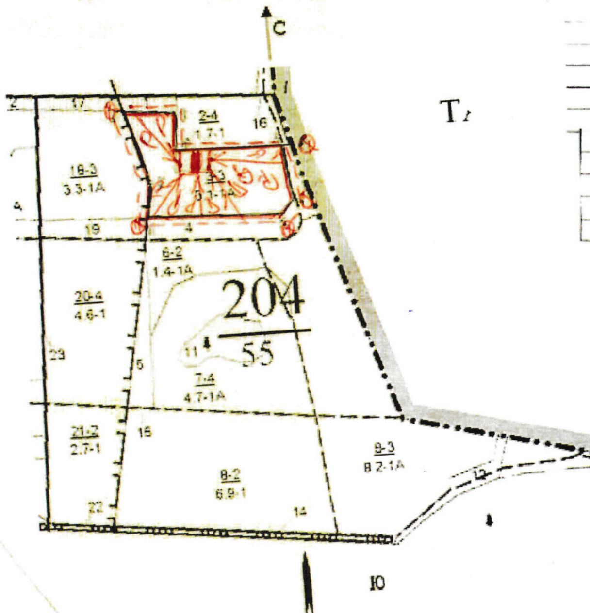
Схема (схемы) выполнения технологических операций по видам мероприятий ухода за лесами