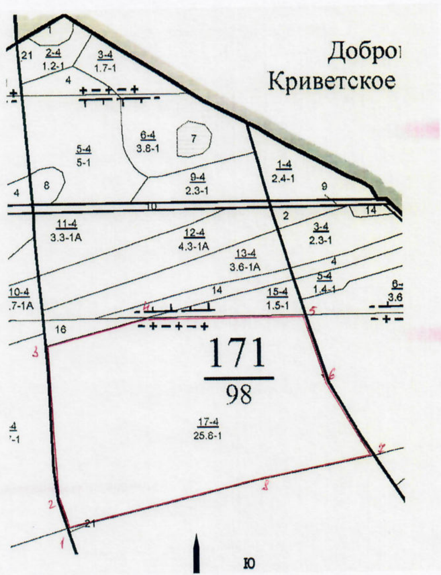
Румбы и длины линий