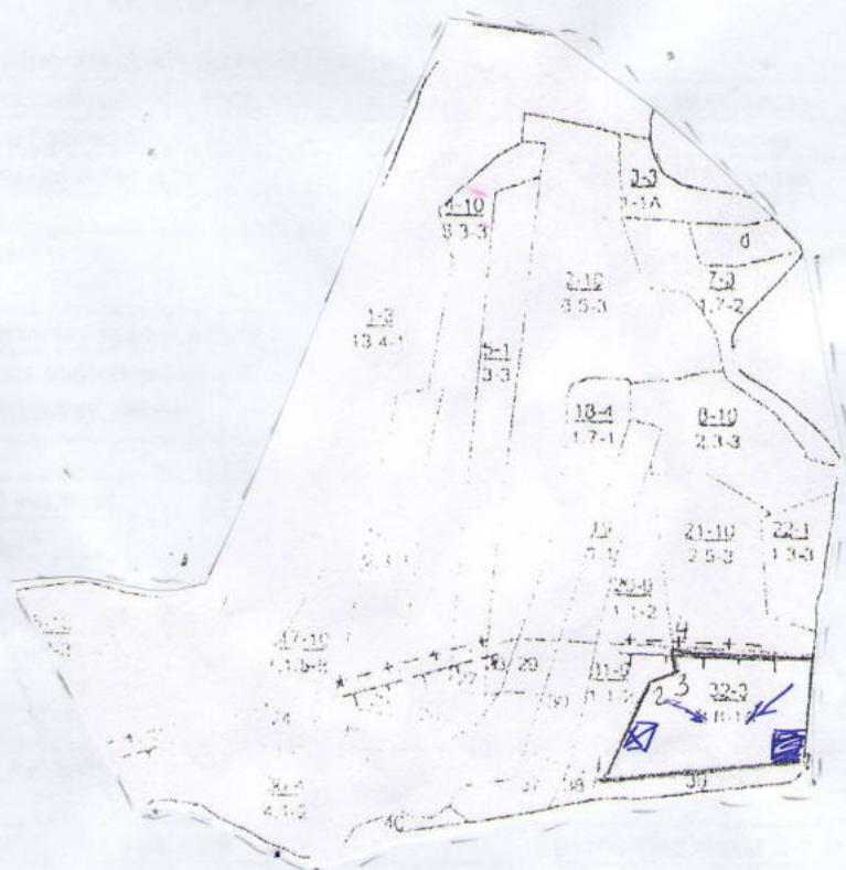
Схема (схемы) выполнения технологических операций по видам мероприятий ухода за лесами