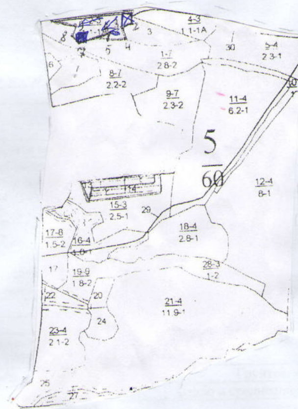
Схема (схемы) выполнения технологических операций по видам мероприятий ухода за лесами