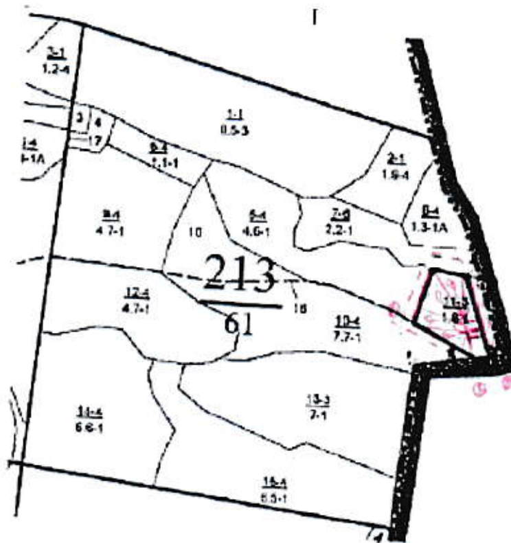
Схема (схемы) выполнения технологических операций по видам мероприятий ухода за лесами