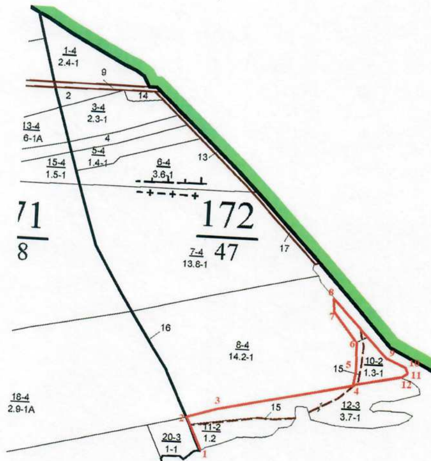
Румбы и длины линий