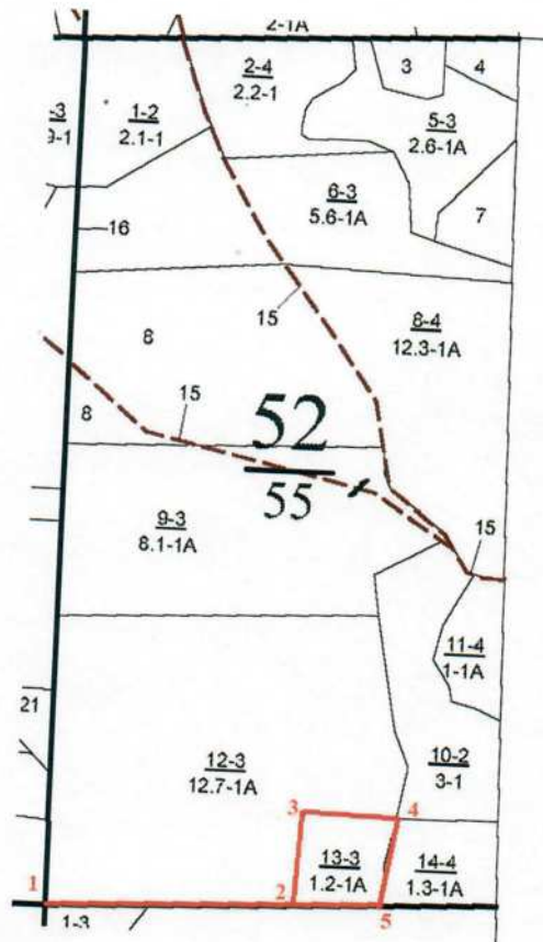
Румбы и длины линий