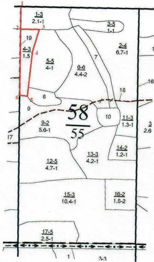
Румбы и длины линий