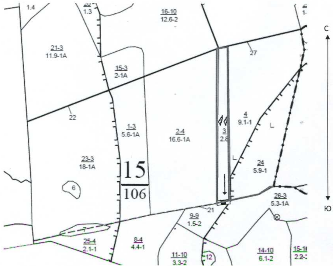
Схема (схемы) выполнения технологических операций по видам мероприятий ухода за лесами