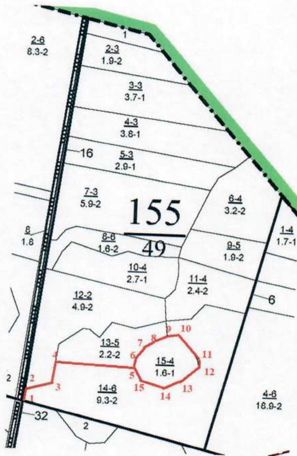
Румбы и длины линий