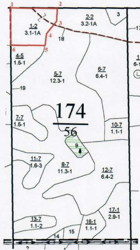
Румбы и длины линий