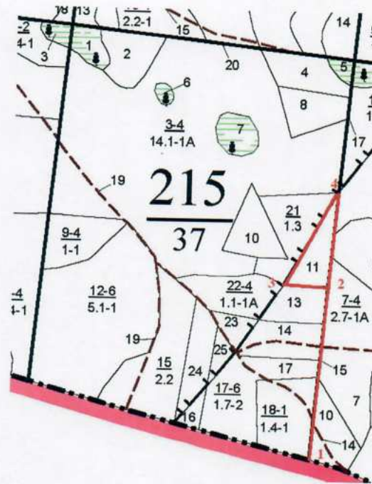
Румбы и длины линий