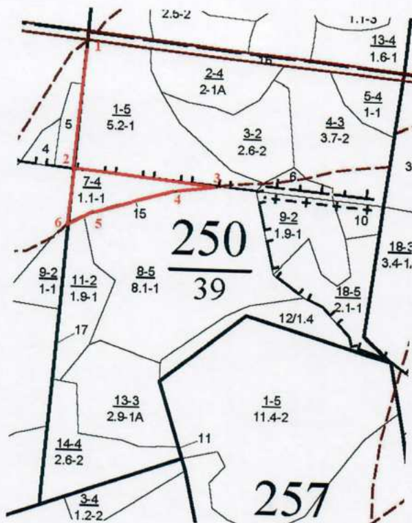
Румбы и длины линий