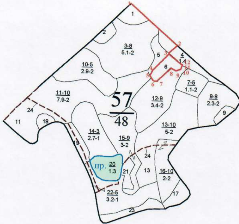
Румбы и длины линий