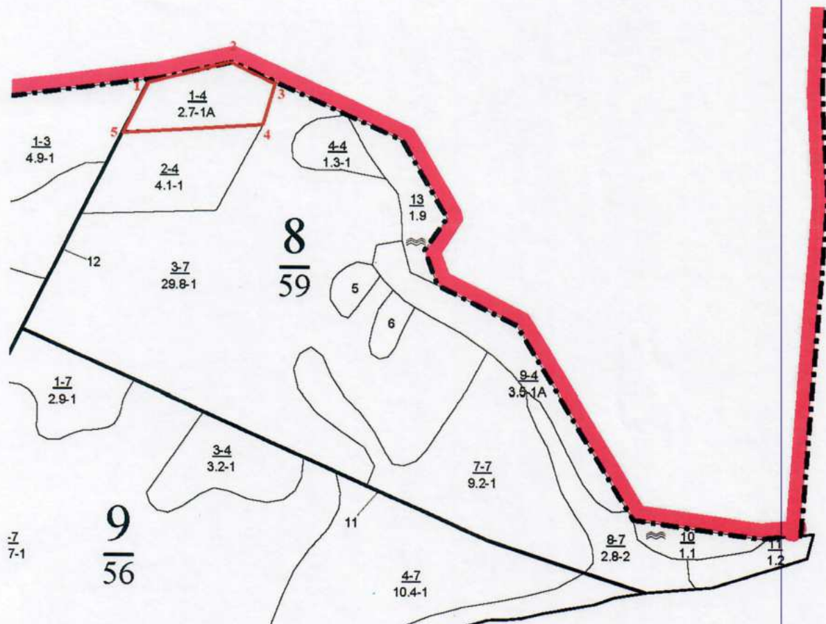
Румбы и длины линий