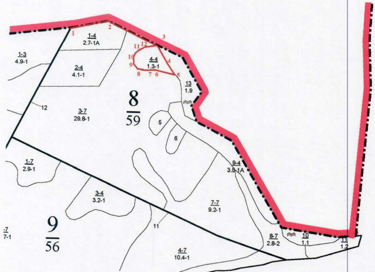
Румбы и длины линий