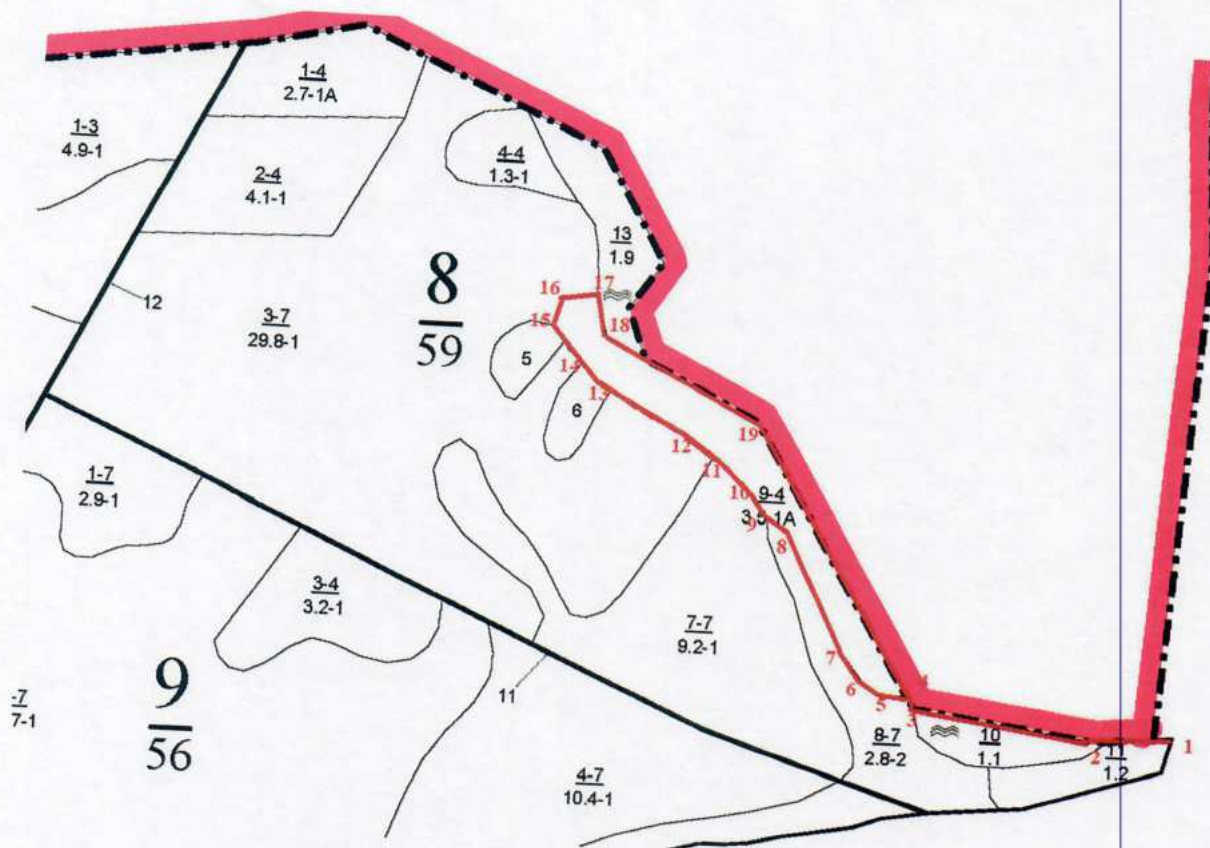
Румбы и длины линий