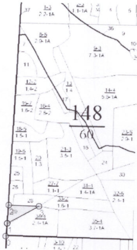
Общая схема участка и его привязки Румбы и длины линий

Технологическая схема (схемы) проведения мероприятия ухода за лесами (рубок ухода, дополнительных лесовосстановительных, противопожарных, лесозащитных и других мероприятий)