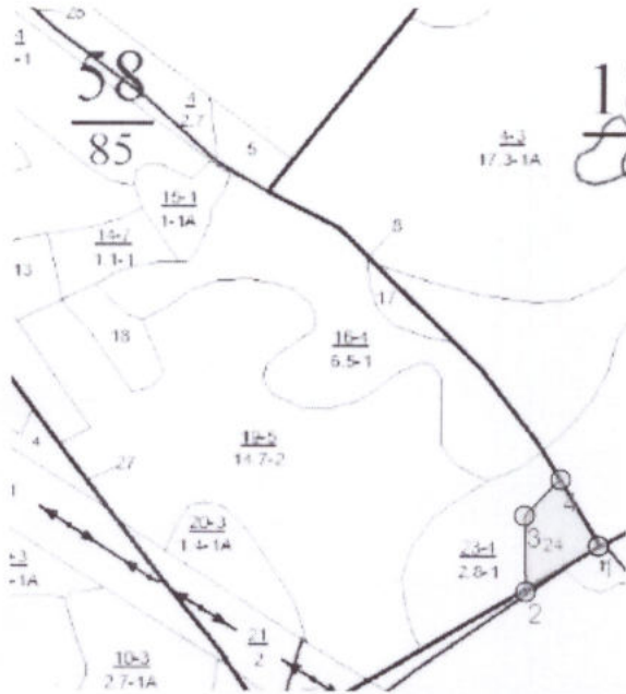
Общая схема участка и его привязки Румбы и длины линий

Технологическая схема (схемы) проведения мероприятия ухода за лесами (рубок ухода, дополнительных лесовосстановительных, противопожарных, лесозащитных и других мероприятий)