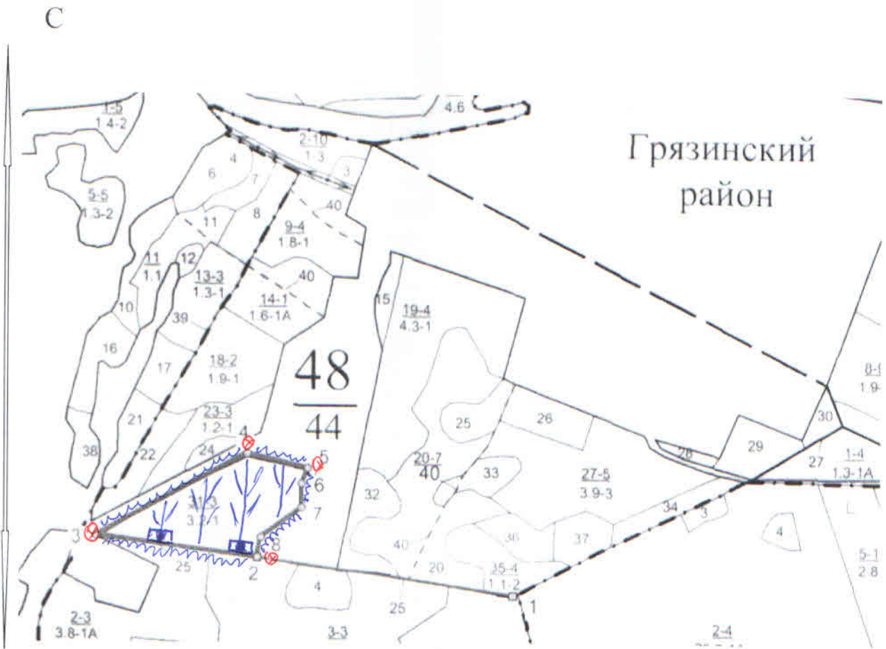
Схема (схемы) выполнения технологических операций по видам мероприятий ухода за лесами